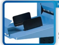
Uscita Delivery table