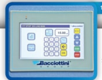
Schermo touch screen 7" Touch screen 7"